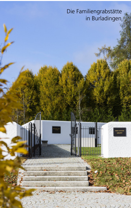
Die Familiengrabstätte in Burladingen.